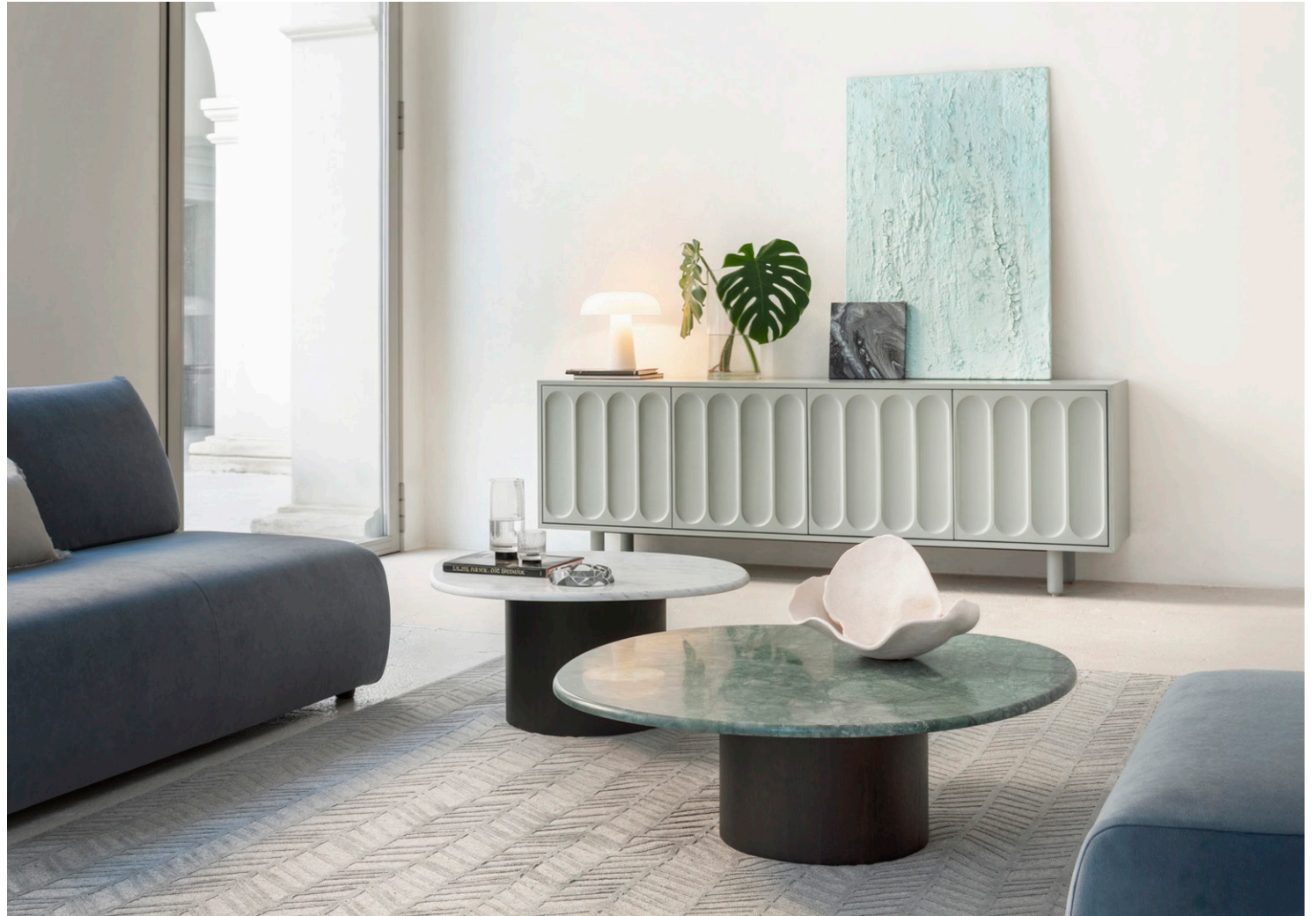
Immagine di riferimento Example image