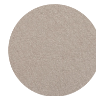
Nabuk Conchiglia Conchiglia nubuk