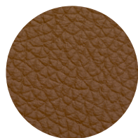
Pelle cognac Cognac leather