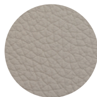
Pelle oyster Oyster leather