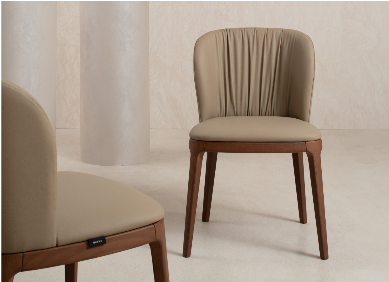
Immagine di riferimento Example image