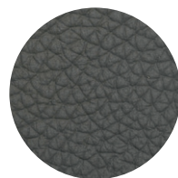
Pelle antracite Antracite leather