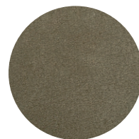
Nabuk Salvia Salvia nubuk