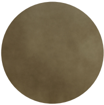
Legno laccato bronzo ossidato Oxidized bronze lacquered wood