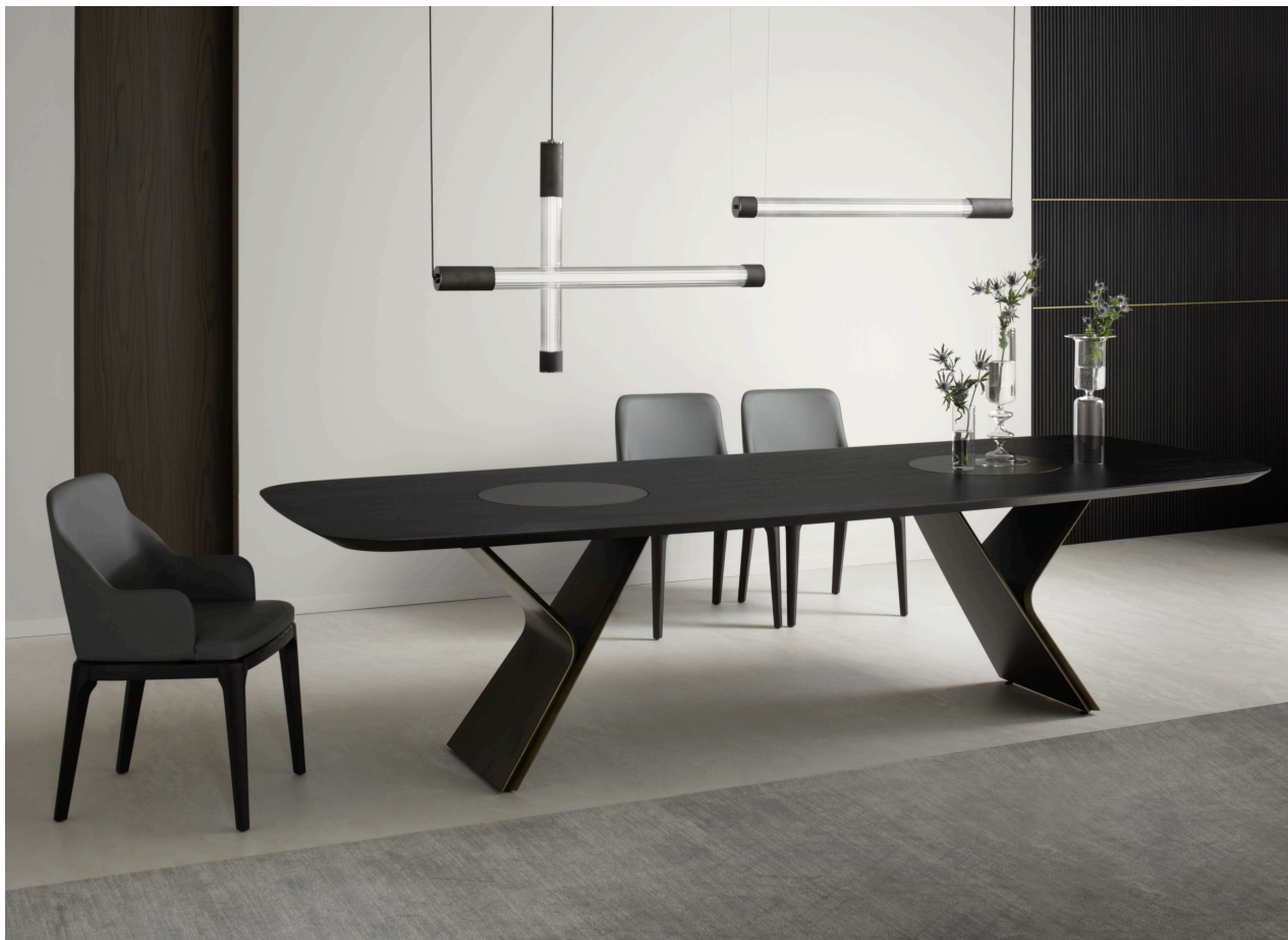
Immagine di riferimento Example image