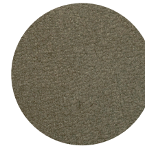
Nabuk Salvia Salvia nubuck