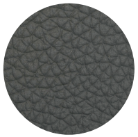
Pelle Antrcite Anthracite leather