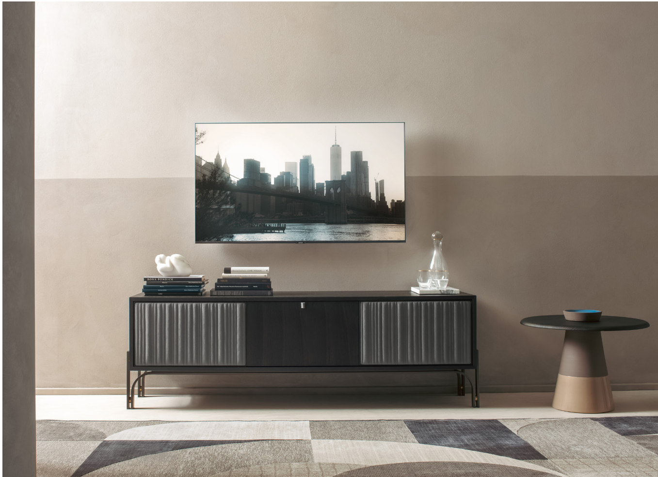
Immagine di riferimento Example image