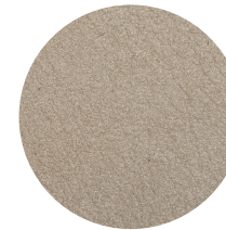
Nabuk Conchiglia Conchiglia nubuck