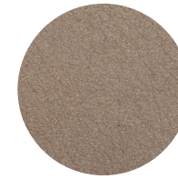
Nabuk Conchiglia Conchiglia nubuck