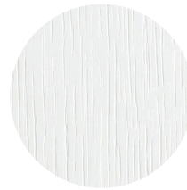
Rovere bianco White oak