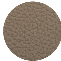
Pelle Tortora Tortora leather