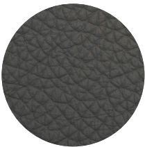
Pelle Antracite Anthracite leather