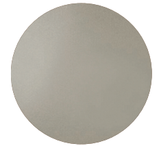
Metallo Champagne Champagne metal