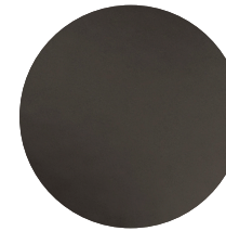
Metallo Brunito Dark Burnished metal