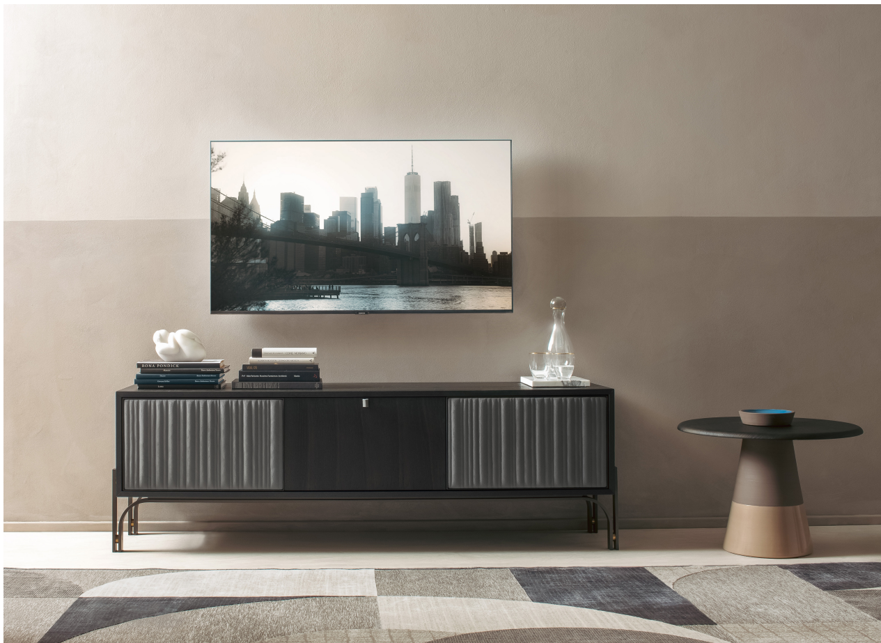
Immagine di riferimento Example image