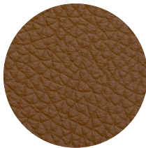
Pelle Cognac Cognac leather