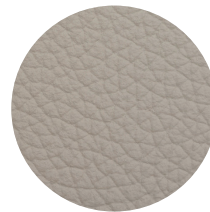
Pelle Oyster Oyster leather