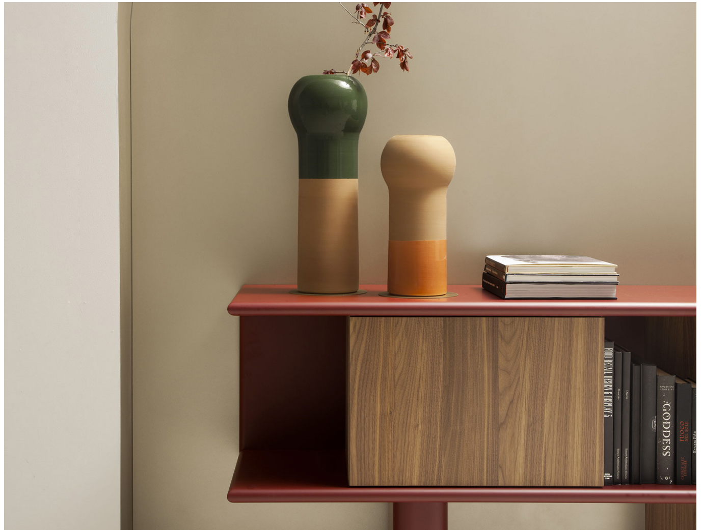
Immagine di riferimento Example image