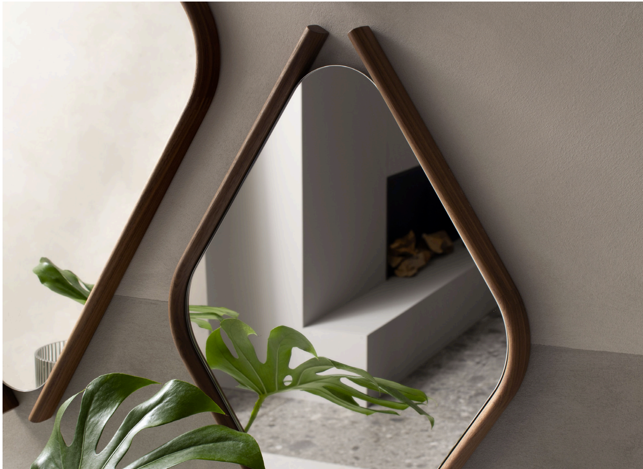
Immagine di riferimento Example image