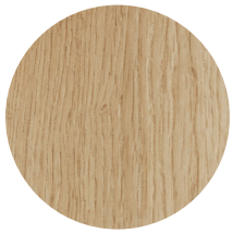
Rovere naturale Oak wood