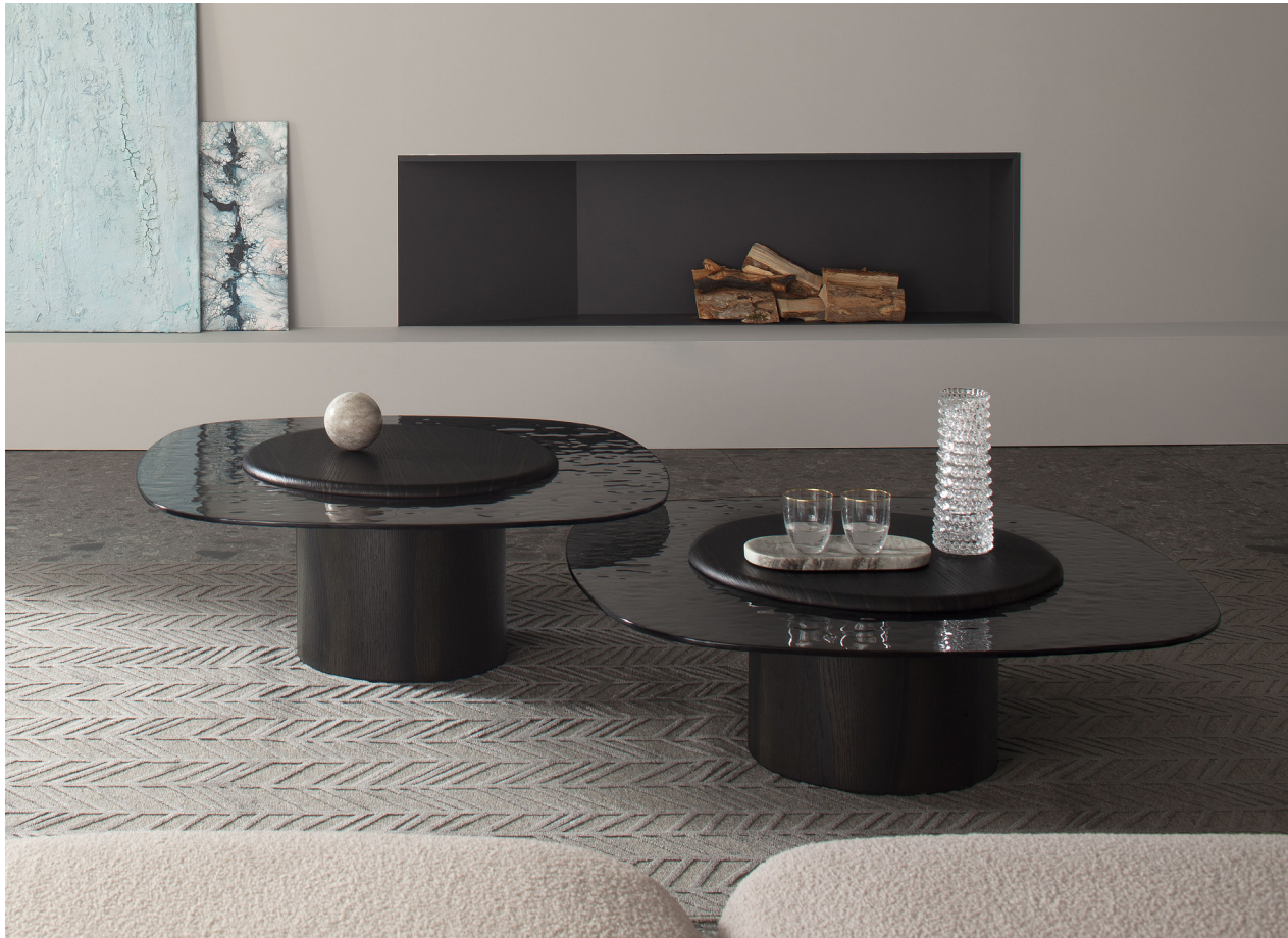
Immagine di riferimento Example image