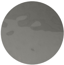
Vetro martellato fumé Hammed smoked glass