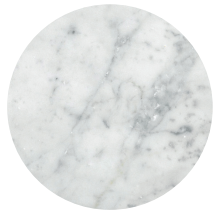
Marmo di Carrara Carrara marble