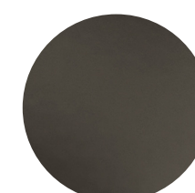
Metallo brunito Burnished metal