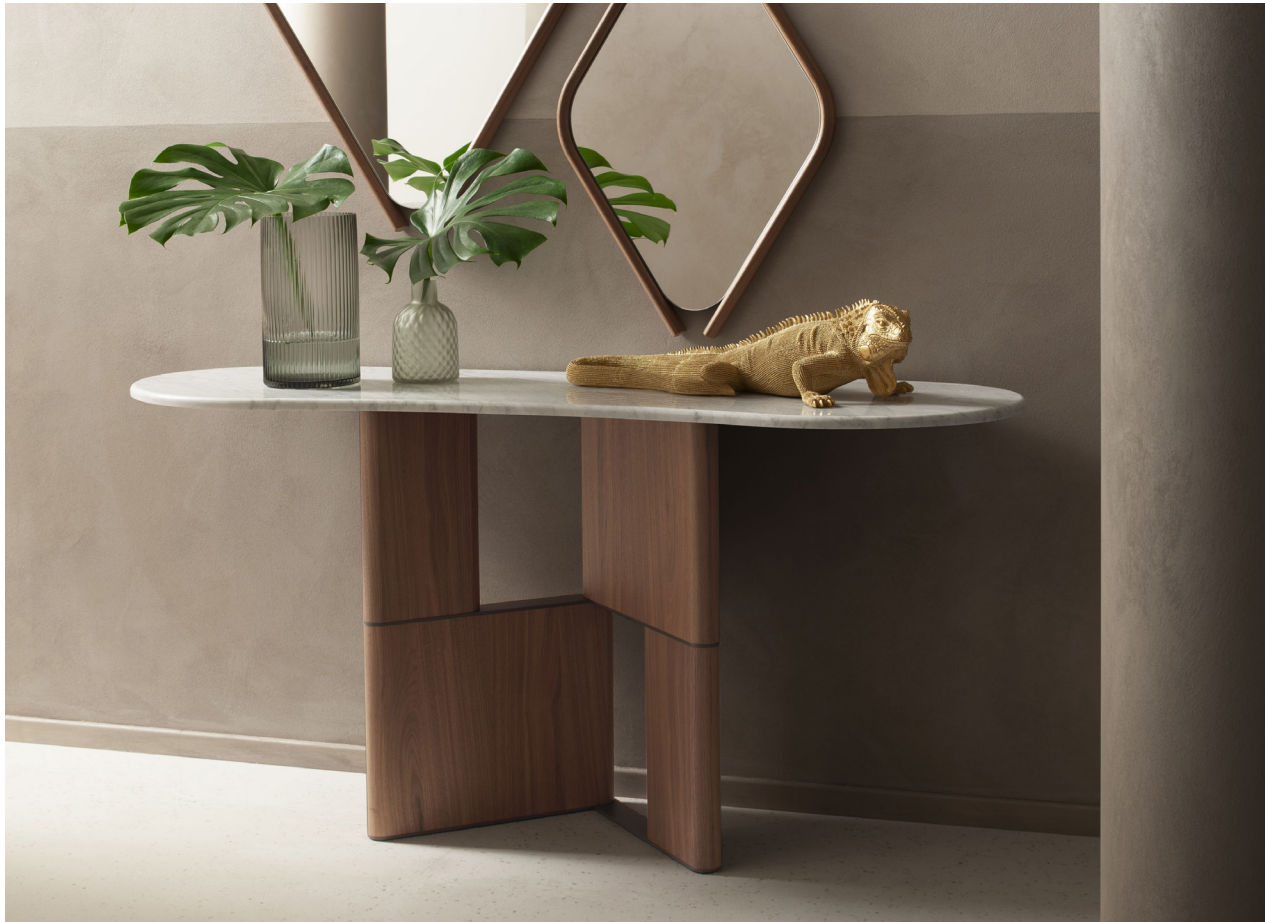
Immagine di riferimento Example image