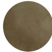
Legno laccato bronzo ossidato Oxidized bronze lacquered wood