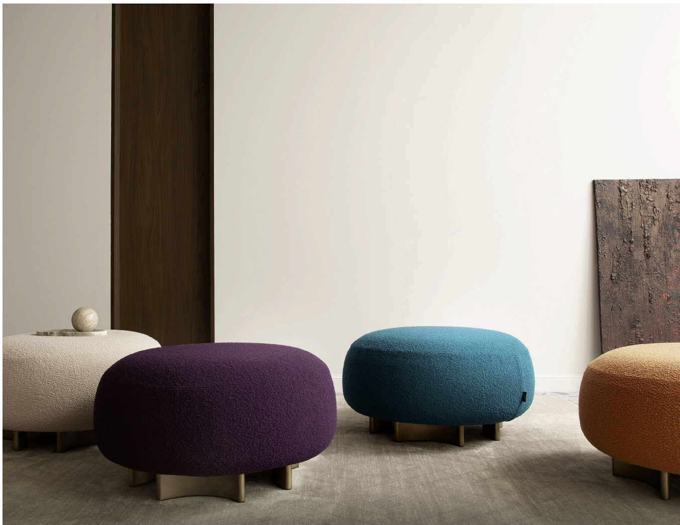
Immagine di riferimento Example image

Rilassati, il tuo pouf Punto e Virgola arriverà già montato. Relax, your Punto e Virgola pouffe will arrive already assembled.