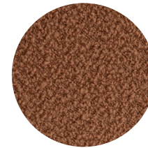
Bouclé Caramello Caramello Bouclé