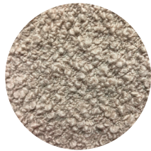
Bouclé Cipria Cipria Bouclé