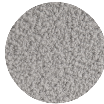
Bouclé grigio Perla Perla grey Bouclé