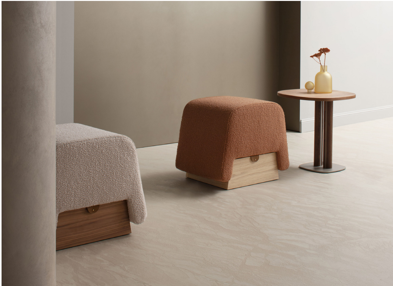
Immagine di riferimento Example image