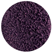
Bouclé viola Violet Bouclé