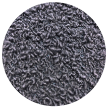
Bouclé blu Denim Denim blue Bouclé