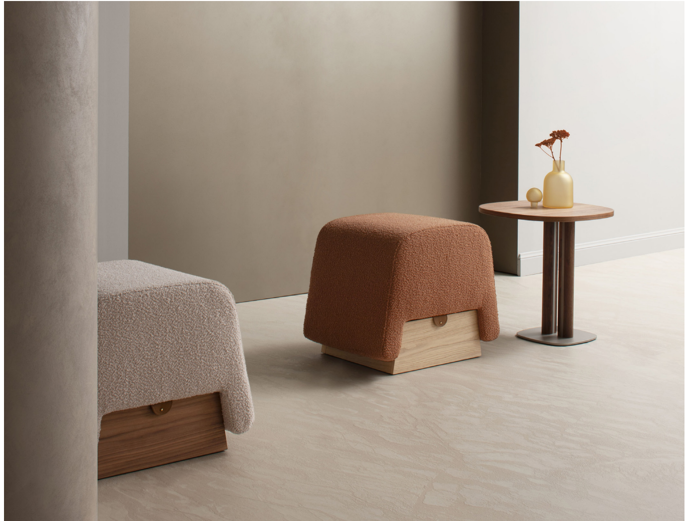
Immagine di riferimento Example image

Rilassati, il tuo pouf Onigiri arriverà già montato. Relax, your Onigiri pouffe will arrive already assembled.