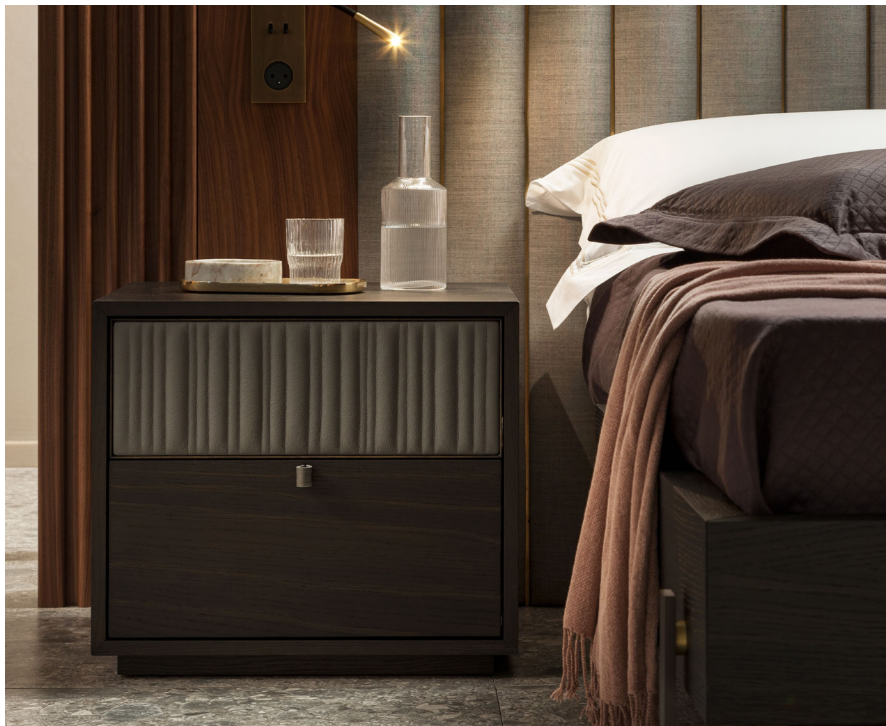
Immagine di riferimento Example image

Rilassati, il tuo comodino Canette arriverà già montato. Relax, your Canette night stand will arrive already assembled.