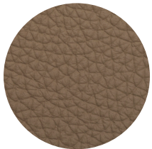
Pelle tortora Tortora leather