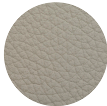
Pelle oyster Oyster leather