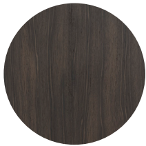
Frassino tinto rovere scuro Dark oak-stained ash