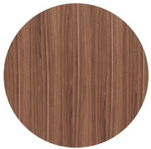
Frassino tinto noce Walnut-stained sessile ash