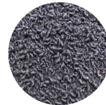
Bouclé blu denim Blue denim bouclé