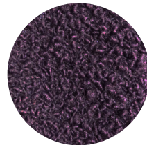
Bouclé viola Violet bouclé