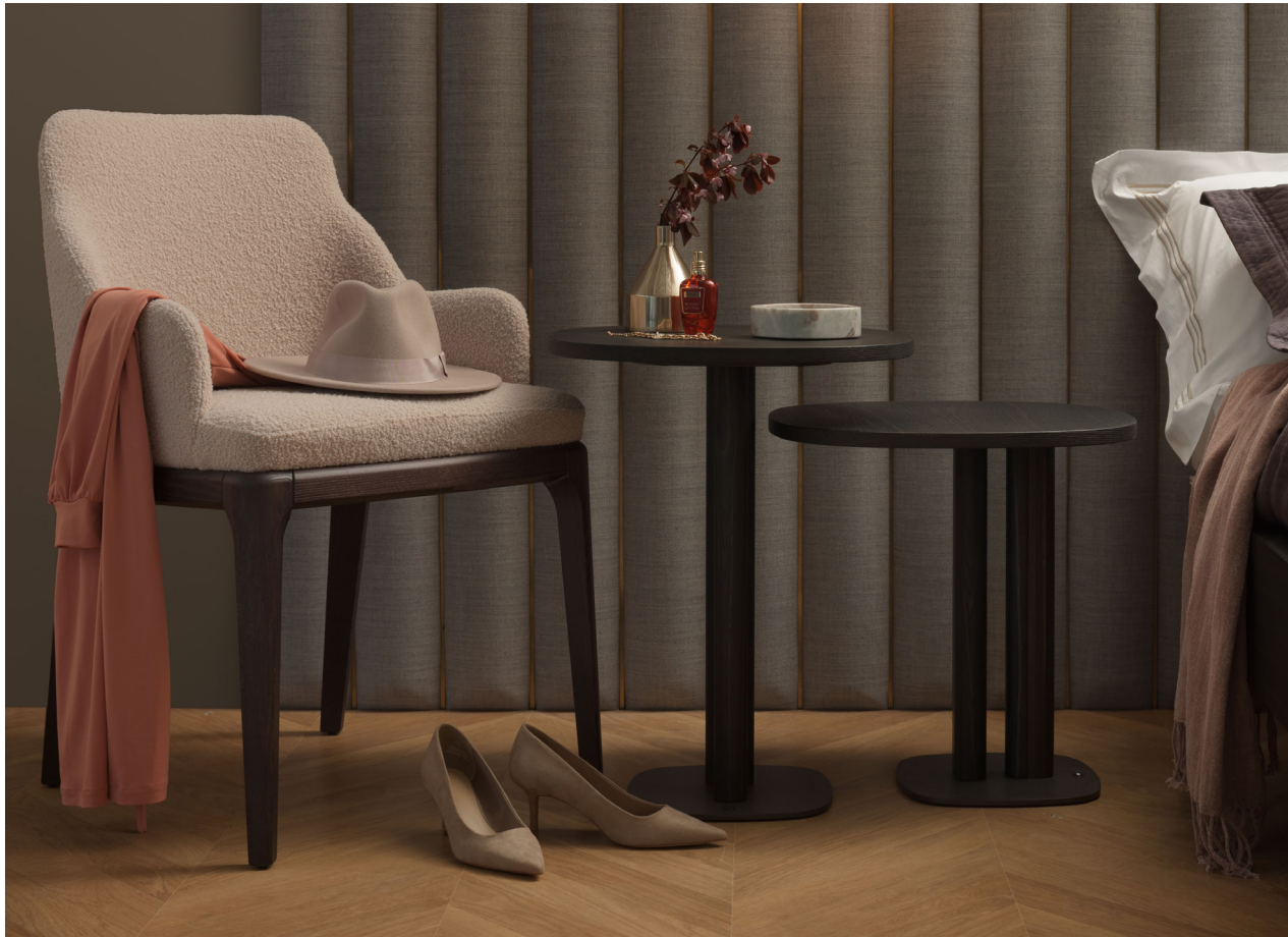
Immagine di riferimento Example image