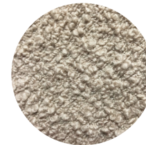
Bouclé cipria Powder pink bouclé