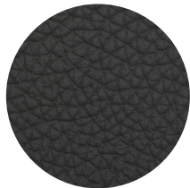
Pelle antracite Antracite leather