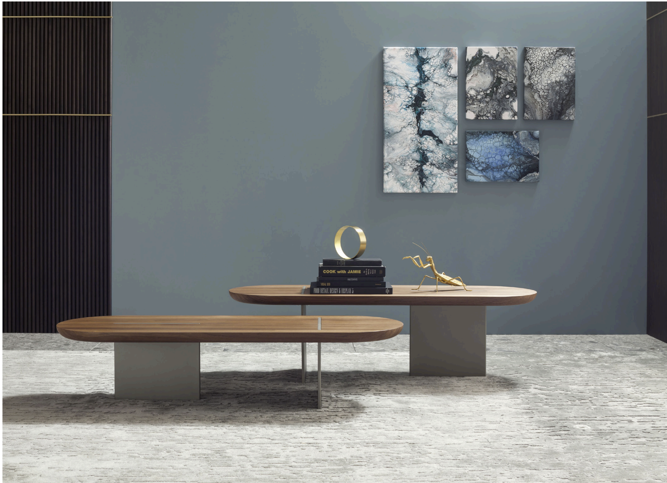
Immagine di riferimento Example image