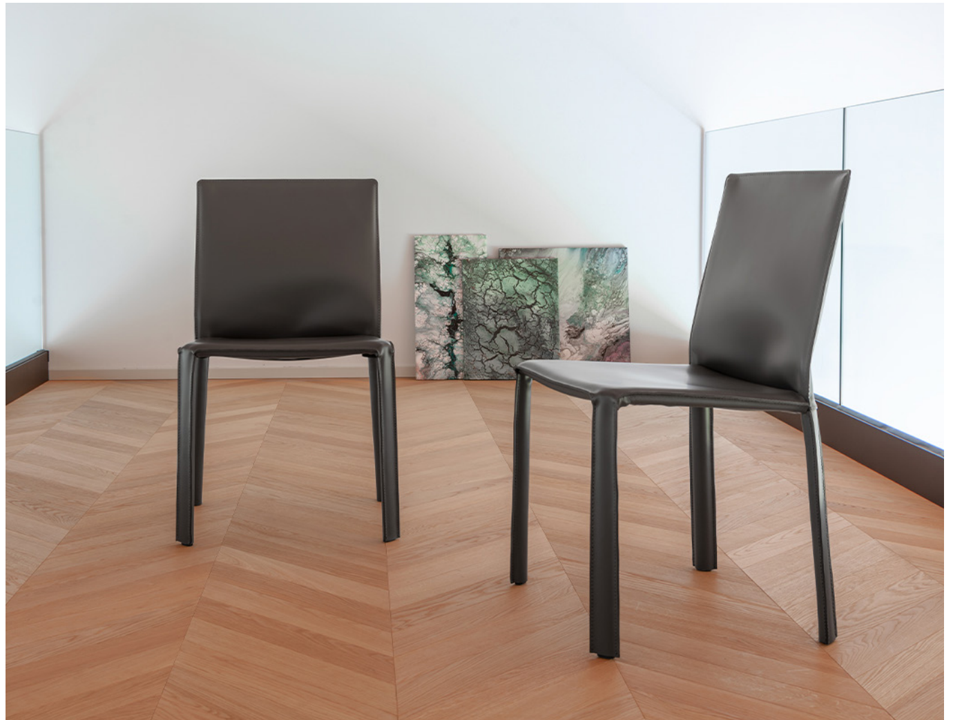
Immagine di riferimento Example image

Rilassati, la tua sedia Jumpsuite arriverà già montata. Relax, your Jumpsuite chair will arrive already assembled.