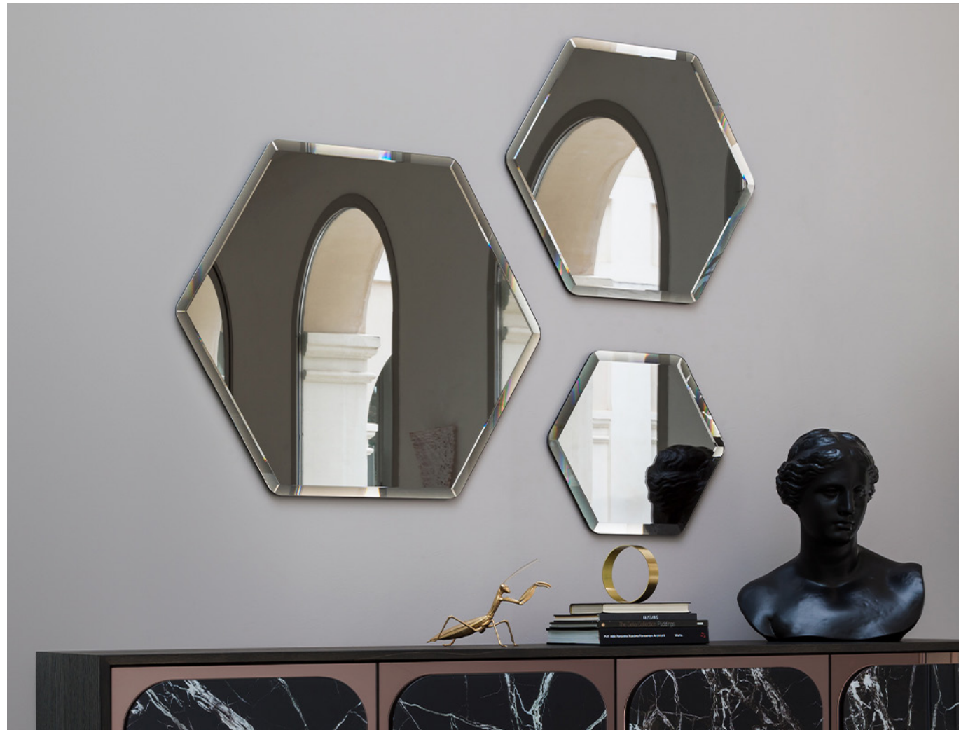
Immagine di riferimento Example image

Rilassati, il tuo specchio Ruby arriverà già montato. Relax, your Ruby mirror will arrive already assembled.