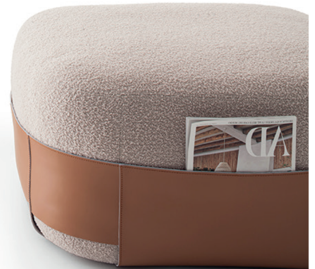
Immagine di riferimento Example image