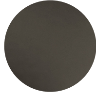
Metallo Brunito Dark Burnished metal

FINITURE STRUTTURA FINISHES FOR THE STRUCTURE