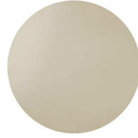
Metallo Champagne Champagne metal