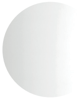
Specchio argento Silver mirror

FINITURE SPECCHIO FINISHES FOR THE MIRROR