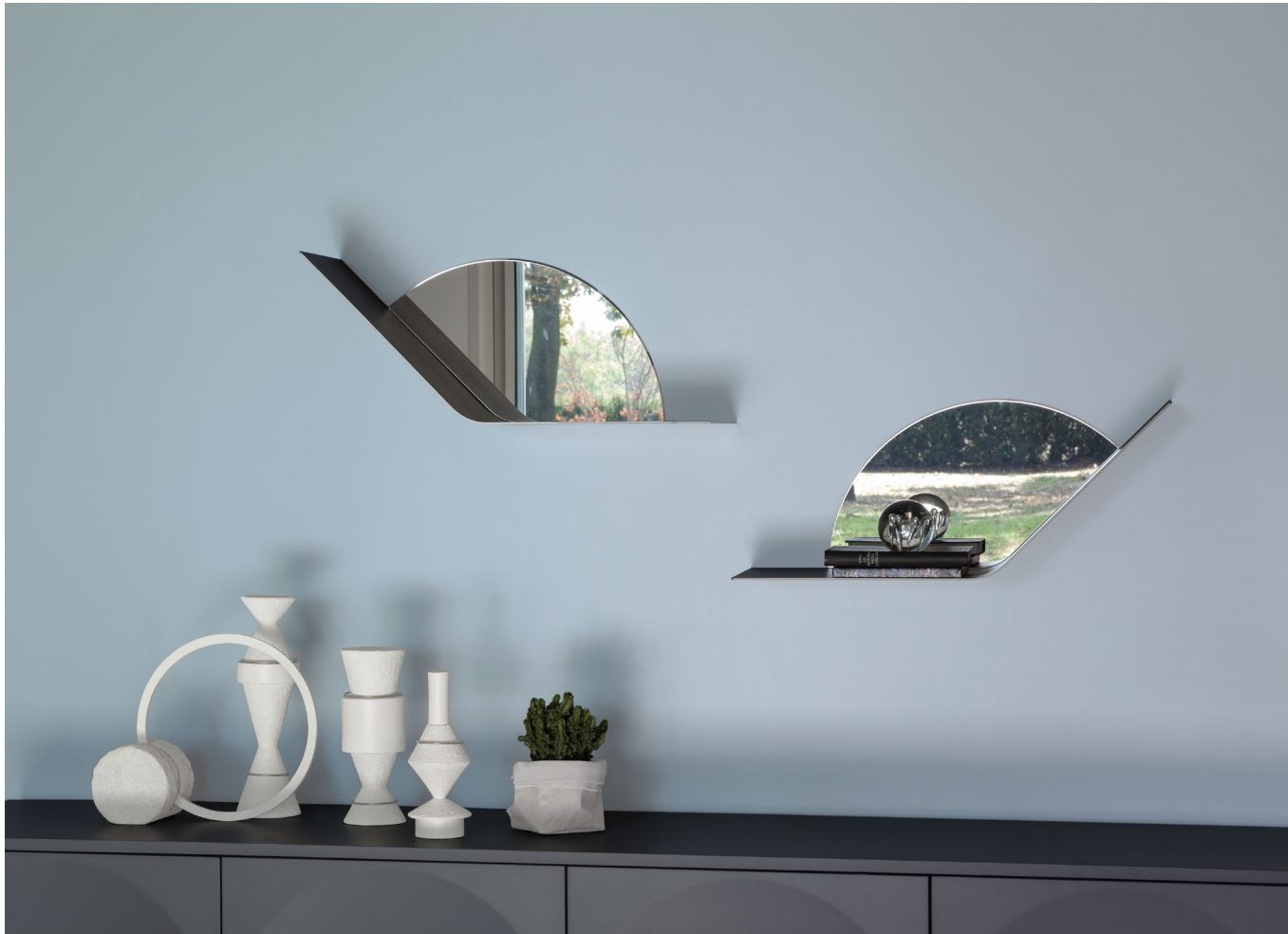
Immagine di riferimento Example image