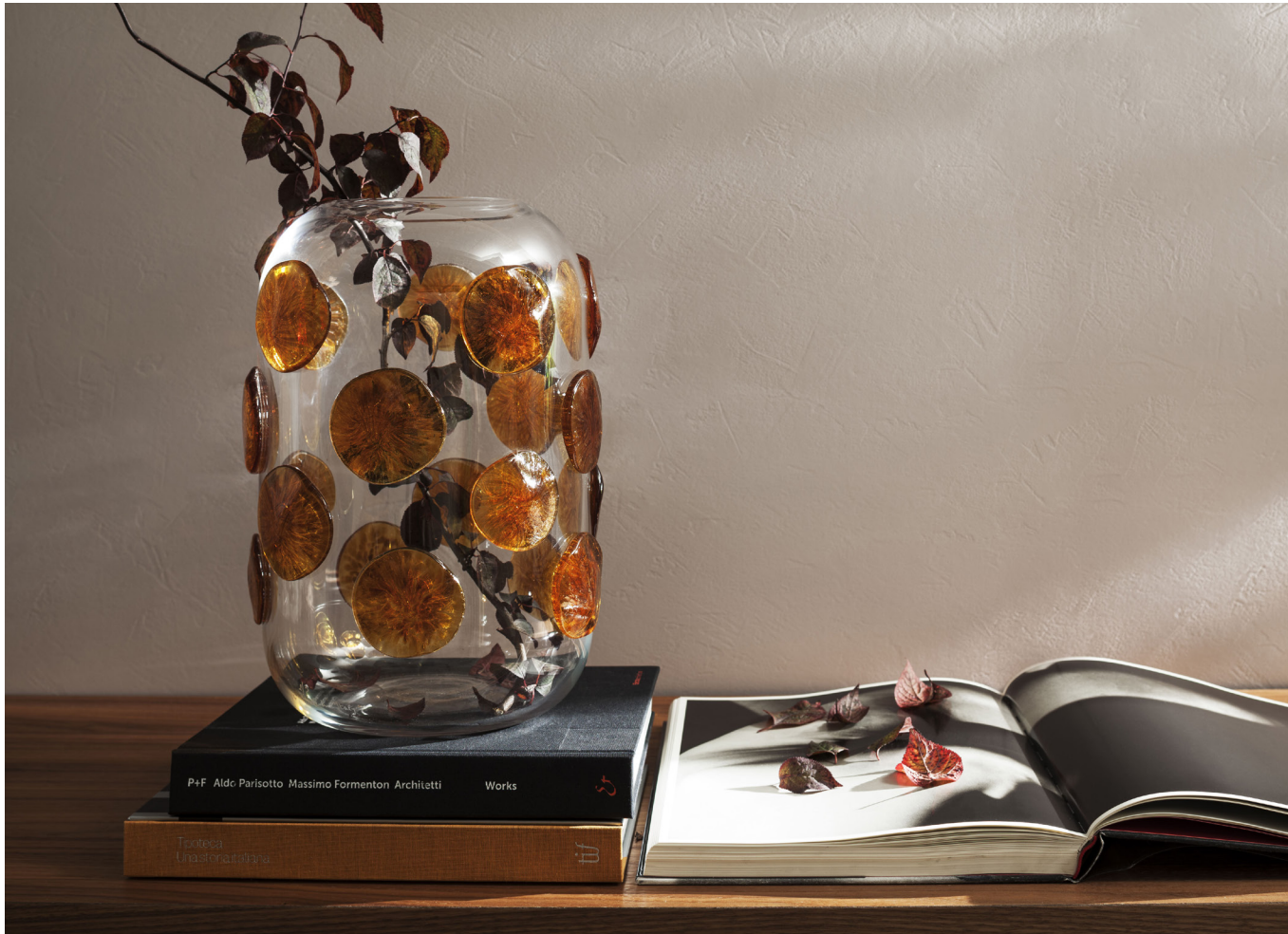
Immagine di riferimento Example image

Scheda tecnica di prodotto Product technical sheet