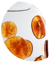
Vetro di Murano Murano glass

FINITURE STRUTTURA FINISHES FOR THE STRUCTURE